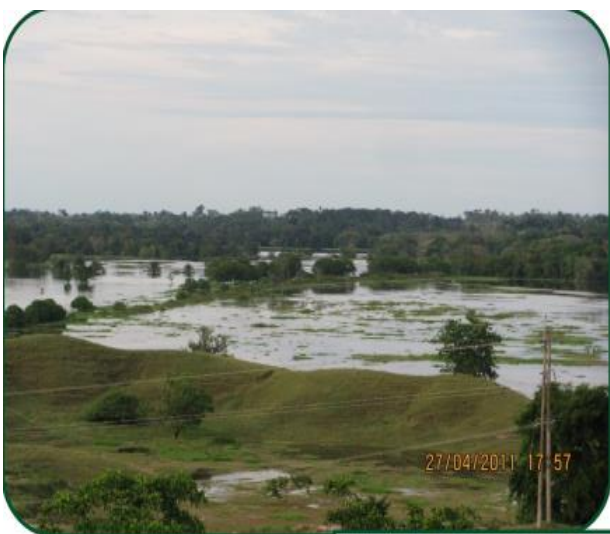
Puerto Boyacá, abril de 2011

Entre el 15 de noviembre 1914 y el 31 de diciembre de 2019 se han presentado 67.789 eventos en Colombia de los cuales 20.085 han sido inundaciones, lo que equivale al 30%. Se concentran en cinco departamentos: Valle del Cauca, Antioquia, Cundinamarca,